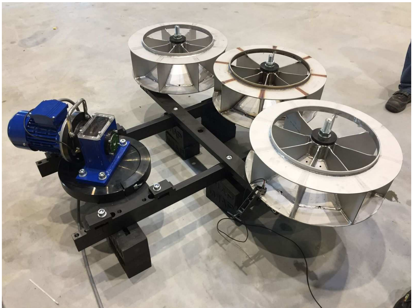
Drei Impeller mit einem Durchmesser von 800 mm auf einer Mehrfach-Aufspannvorrichtung.

Kleinteile unter 100 kg Masse gelten bisher noch als weniger geeignet für eine Vibrationsentspannung. Diesen Umstand nahm die WIAP AG zum Anlass, eine neue Mehrfachaufspannvorrichtung zu entwickeln, mit der alle Richtungen und alle Zonen in nur einer Aufspannung angeregt werden können. Die Mehrfachaufspannvorrichtung ist so konzipiert, dass sie sich für diverse Bauteilarten erweitern lässt. Beispielsweise sollen lange dünne Bauteile am gesamten Bauteil, also nicht nur in der oberer Zone, eine Extremauslenkung erhalten und am Befestigungspunkt nur eine kleine. Sämtliche Zonen eines Bauteiles sollen in alle Achsrichtungen angeregt werden. Alle diese Punkte fanden bei der aktuellen Konzeption Berücksichtigung und sind in die neu entwickelten WIAP-Mehrfachaufspannvorrichtungen eingeflossen.