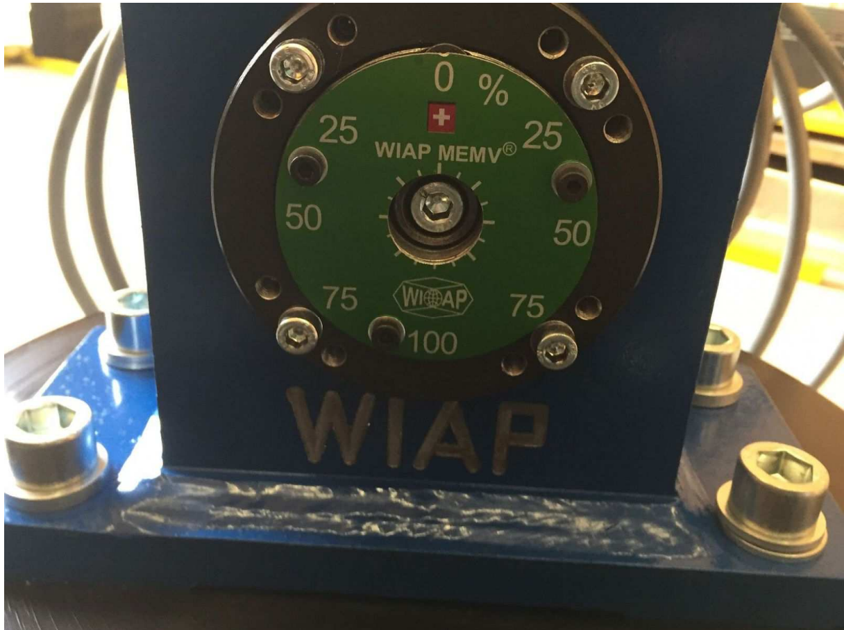
Neuer V20-Anreger mit verschiedenen Einstellmöglichkeiten in % für unterschiedliche Excenterstufen.

Das neueste Modell – ein VV mit verstellbaren Excenterstufen – hat WIAP entwickelt, um sowohl bei tiefen Frequenzen mit hohen Erregerstufen entgegenwirken zu können als auch umgekehrt. Ziel ist jeweils, die Unwuchtstufe zu reduzieren. Mit dieser Anlage kann in der Praxis eine grosse Bandbreite an Anwendungen ohne manuellen Eingriff abgedeckt werden.